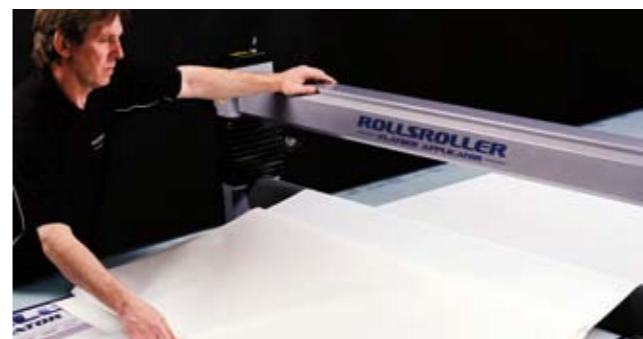
9. Aplicar la otra mitad de la decoración utilizando el rodillo presurizado.