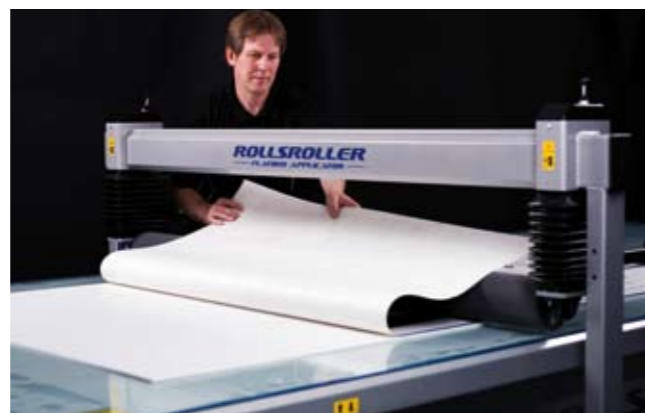
4. Doblar la mitad de la decoración sobre el rodillo.