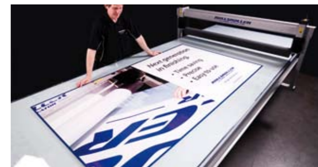
10. Y se obtendrá un rótulo sin arrugas ni burbujas.

"Actualmente tenemos más de 20 ROLLSROLLER®. Ello dice mucho del resultado que hemos conseguido" Trond Aamodt, Euroskilt, Noruega