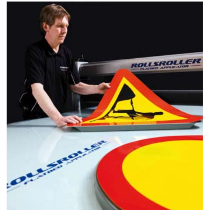
ROLLSROLLER® se utiliza para todo tipo de hojas autoadhesivas. Por ejemplo, en señales de tráfico.

"Esta máquina es excelente. Nos encanta. Trabajos que antes tardaban una hora, los hacemos ahora en diez minutos"