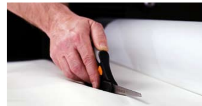
6. Cortar el revestimiento