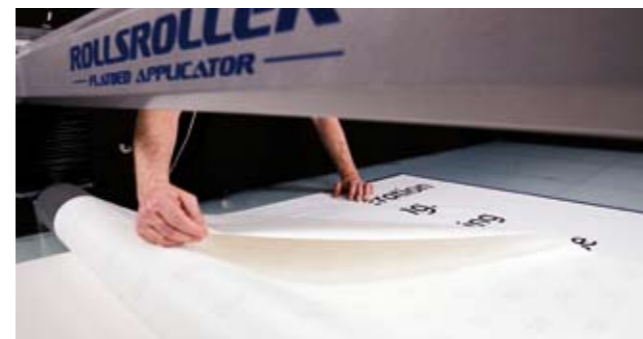
5. Quitar el revestimiento.