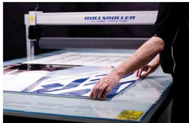
2. Colocar la decoración sobre la base.