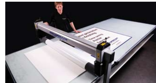
8. Aplicar la mitad de la decoración utilizando el rodillo.