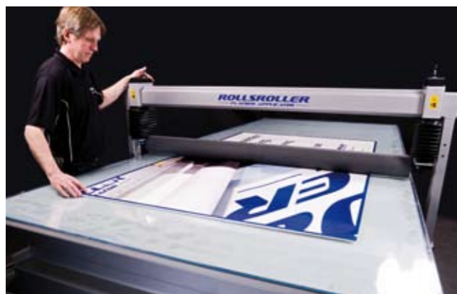
3. Presurizar el rodillo para fijar.