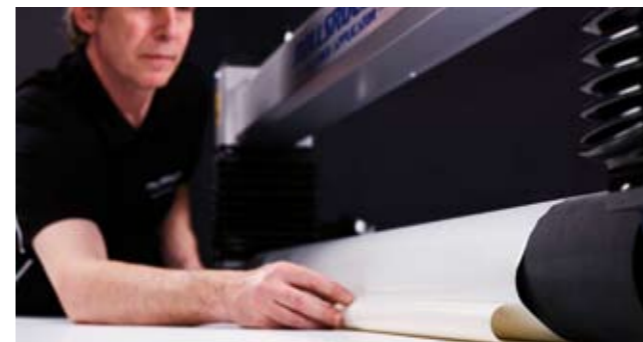
7. Doblar el revestimiento debajo del rodillo.